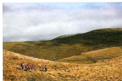
▲ Solidarité, entraide, partage et mixité sont les maîtres-mots de l'action de l'association UMEN. La montagne est accessible pour tous. ◀ Le pilote de la Joëlette doit connaître la montagne et avoir une bonne condition physique.