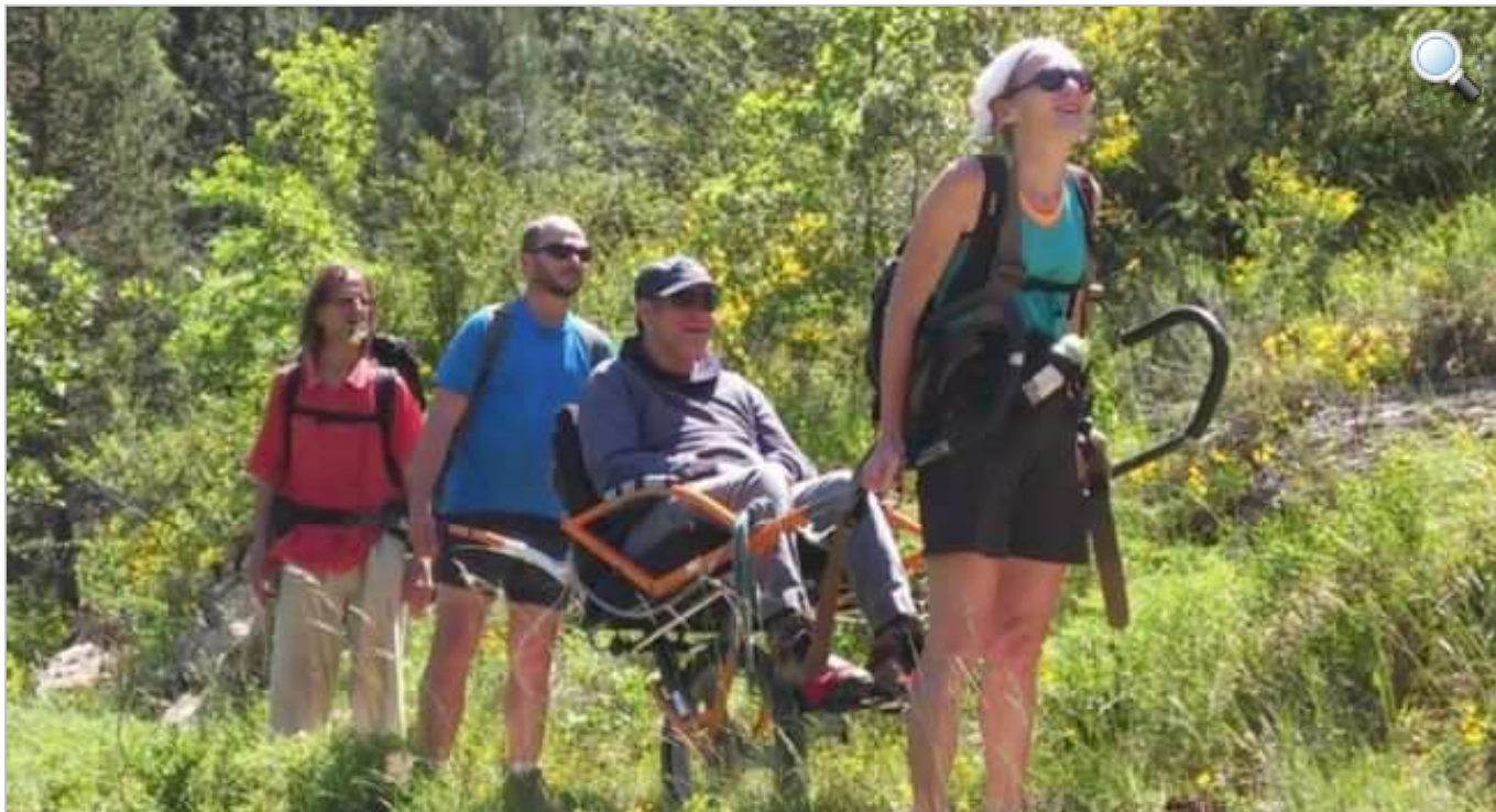
L'emblématique Joelette, du prénom de son inventeur Joël habitant de l'Isère.

Être sport, c'est avant tout un état d'esprit ! Cet adage se vit au quotidien par les adhérents de l'association Umen, installée à la Maison des Sports de Labège, présidée par Eric Le Flochmoen.